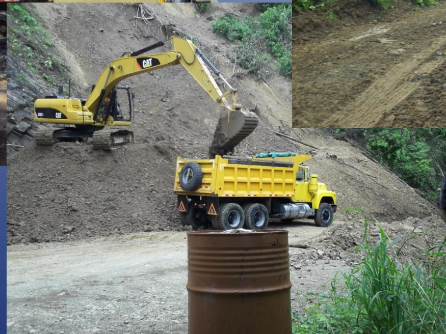
Diversas obras en el Cantón atendidas por la CNE.