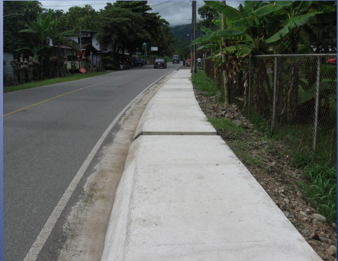
Aceras en Ciudad Cortés.