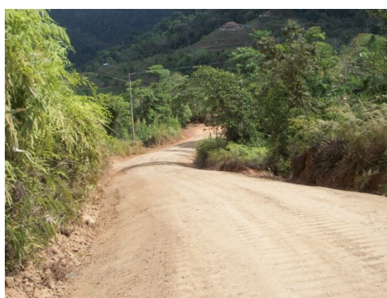
Camino 6-05-036 (Entr.C.6) Tres Ríos a Fila Las Margaritas, Lte. Provincial