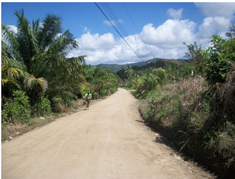
Intervención del camino 6-05-011 (Entr.N.2) San Francisco Tinoco a (Entr.C.184) Paraíso, Escuela.