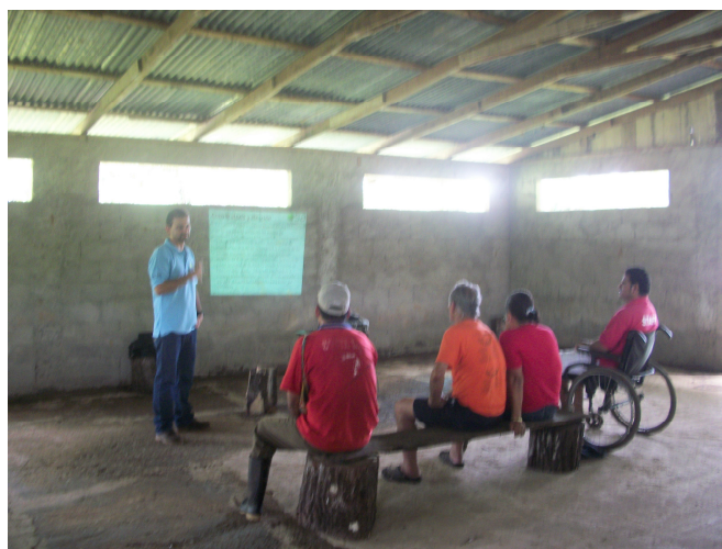
Capacitación a Comité de Caminos de Sábalo (camino 6-05-269) sobre tema Los Comités de Caminos

3.5.4 Fortalecimiento Institucional: Asistencia a Taller sobre la Ley General de Caminos Públicos y Normativa Conexa dirigidas a la Junta Vial Cantonal, Concejo Municipal, Administración y Alcaldía, capacitación que se coordinó con Gestión Municipal del MOPT. Además se impartió por parte del Promotor Social y el Ingeniero una capacitación al personal de la UTGV sobre Participación ciudadana en los Proyectos viales y sobre la Ley 8114. Ver siguiente cuadro: