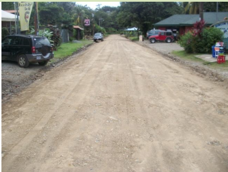
Intervención del camino 6-05-063 Calles Urbanas Cuadrantes Uvita.