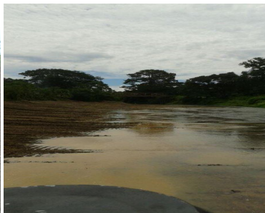
Obras de canalización y protección Río Balsar