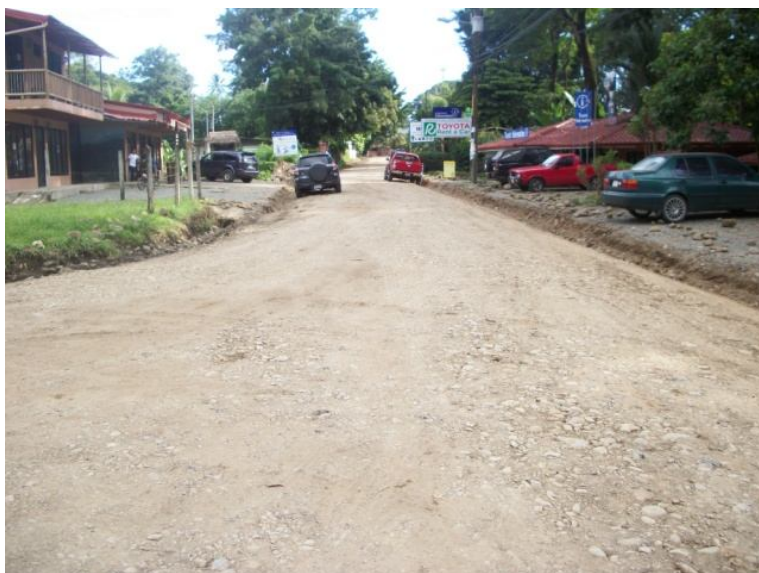
Intervención del camino 6-05-043 (Entr.N.34) Dominical, Barú a Dominical Centro.