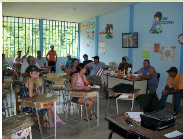
Capacitación a comunidad de Tres Ríos (camino 6-05-006) sobre tema Fiscalización Social de Obras.