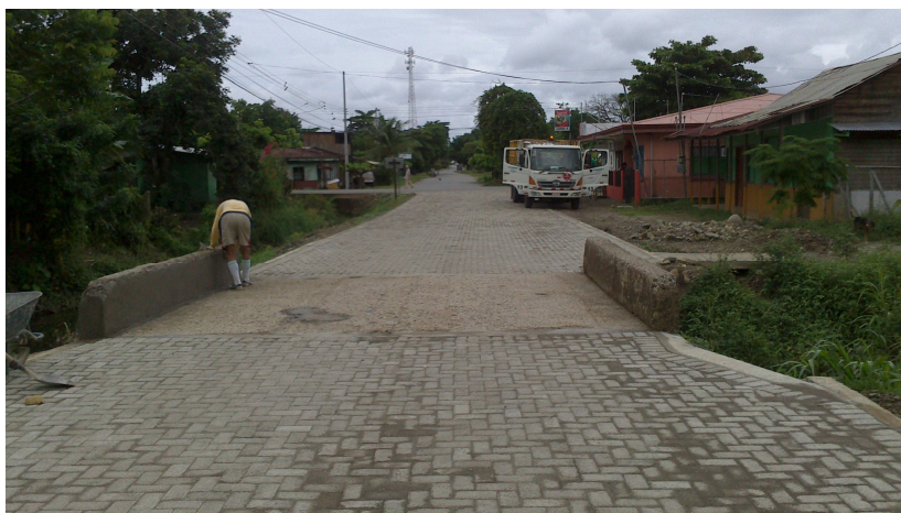
Finalización Proyecto de adoquines en ciudad Cortés, sector Barrio Los Almendros