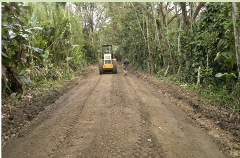
Intervención del camino 6-05-081 (Entr.N.34) Tortuga Abajo a Playa Tortuga