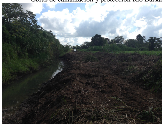
Canalización sobre Quebrada Zapatero