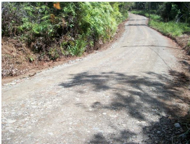
Intervención del camino 6-05-082 (Entr.N.34) Tortuga Abajo a (Entr.C.8) Ojochal –camino El Perezoso-