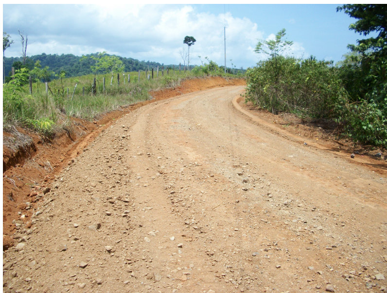
Sector Los Ángeles parte relastreada