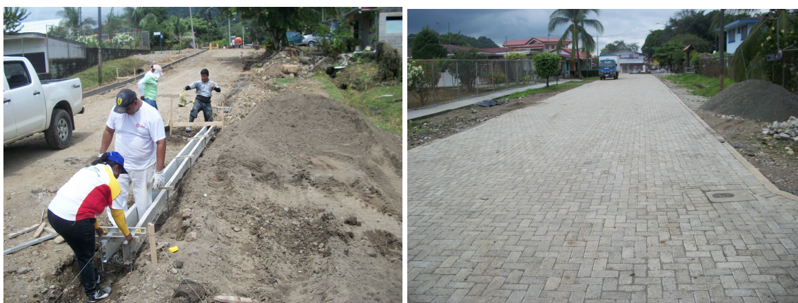
Fábrica y colocación de adoquines en Palmar Norte

Proyecto Fábrica y colocación de adoquines en Cuadrantes Urbanos de Palmar Norte, sector Iglesia Católica, camino 6-05-020.