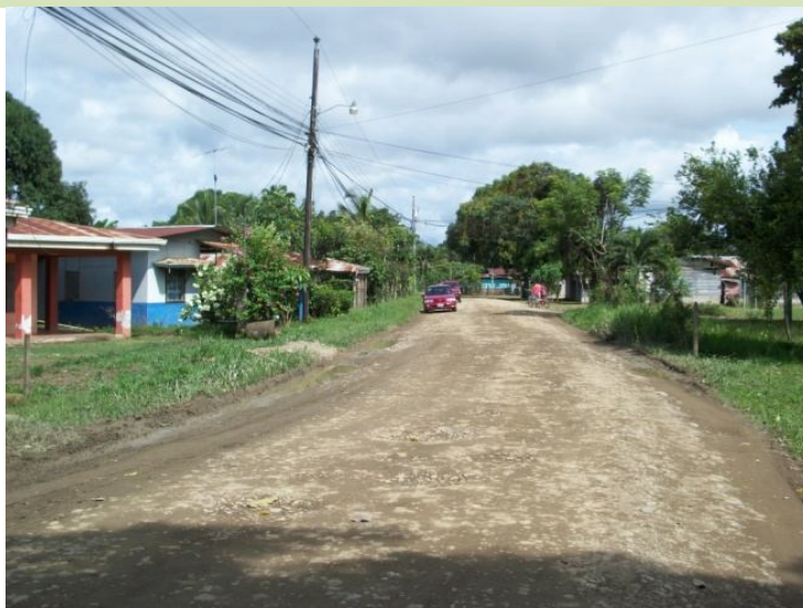
Intervención del camino 6-05-002 (Entr.C.1) Estadio Cortés a (Entr.C.94) Ojo de Agua, Escuela.