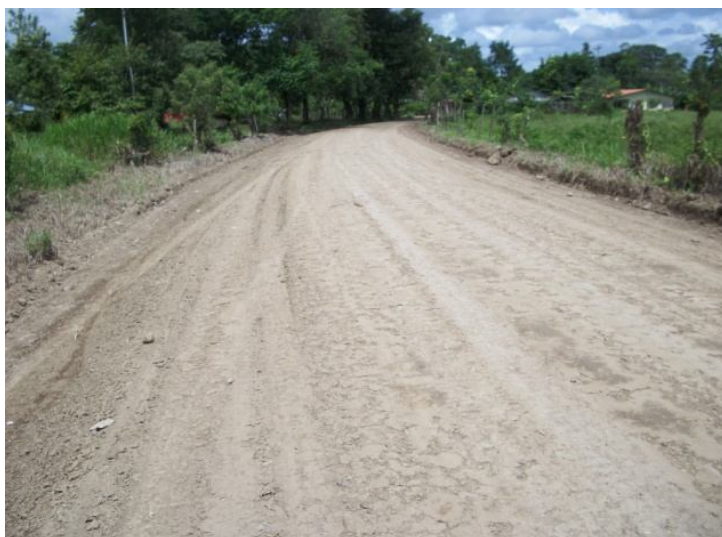
Intervención del camino 6-05-099 Calles Urbanas Cuadrantes Barrio San José, Puerto Cortés.

Nota: Para ver detalle de cada proyecto se encuentra en los archivos del Asistente Técnico de la UTGV.