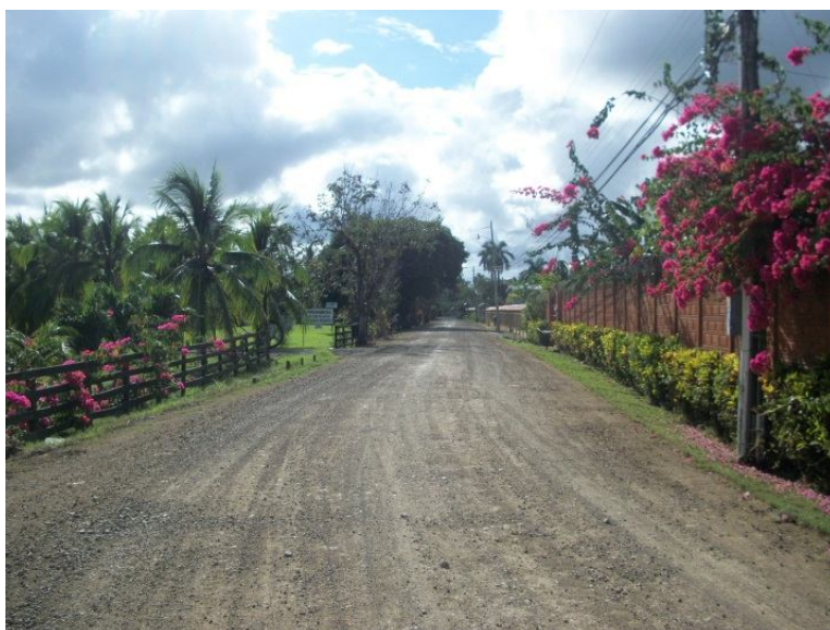
Intervención del camino 6-05-103 Calles Urbanas Cuadrantes Palmar Sur