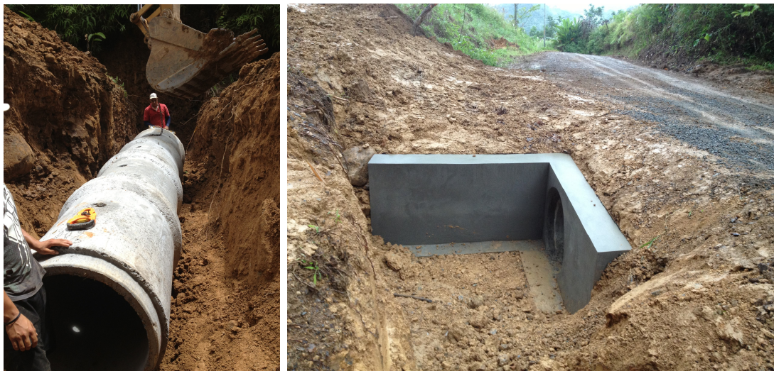
Alcantarillas y cabezales Camino 6-05-238 (Entr.C.7) Vergel a (Entr.C87) Tres Ríos Arriba