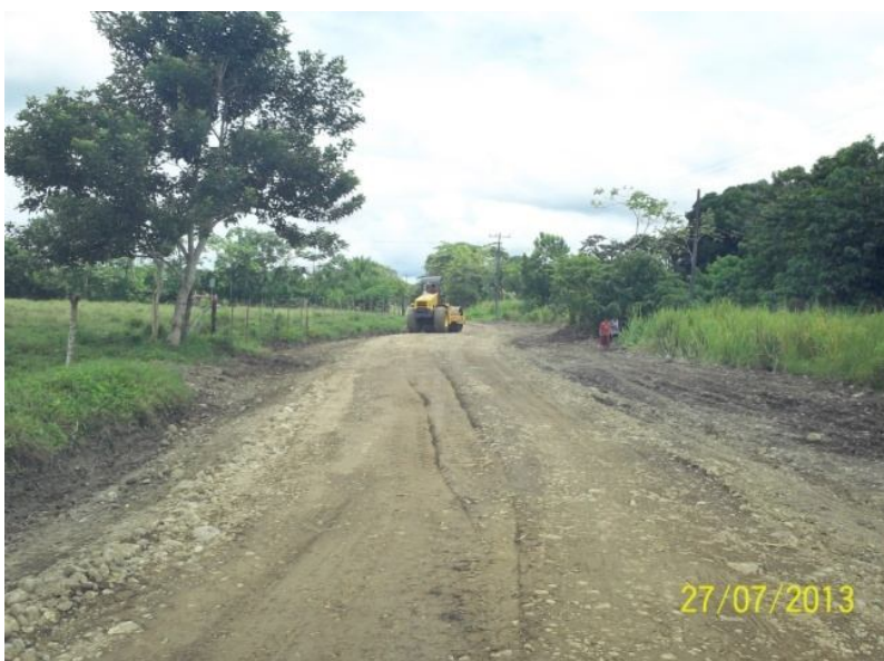
Intervención del camino 6-05-201 (Entr.N.223) Finca 2 y 4 a (entr.C.197) Calle Aserradero