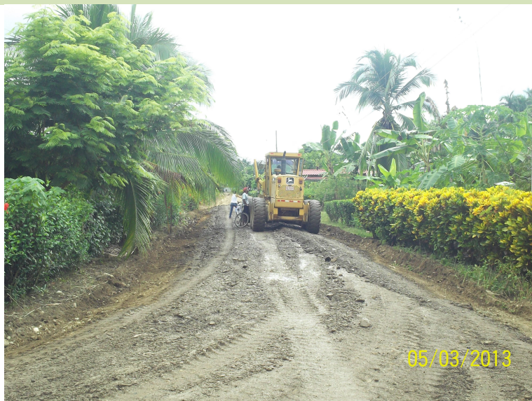
Intervención del camino 6-05-171a Calles Urbanas Cuadrantes Finca Guanacaste.