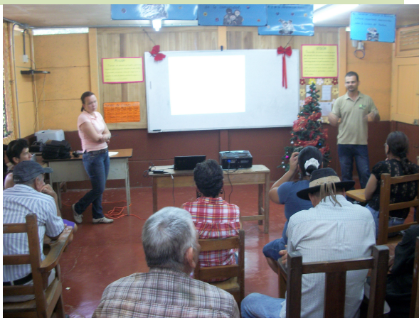
Comunidades de Rincón, El Campo y Vanegas en validación socioambiental del proyecto BID en camino 6-05-031 Rincón-Drake.