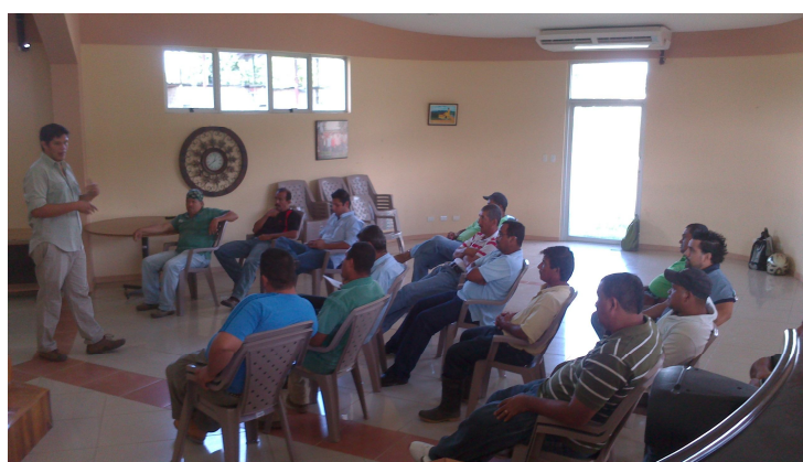
Capacitación con personal de UTGV sobre el tema Ley 8114 y presupuesto 2014 impartida por Ingeniero y Promotor.