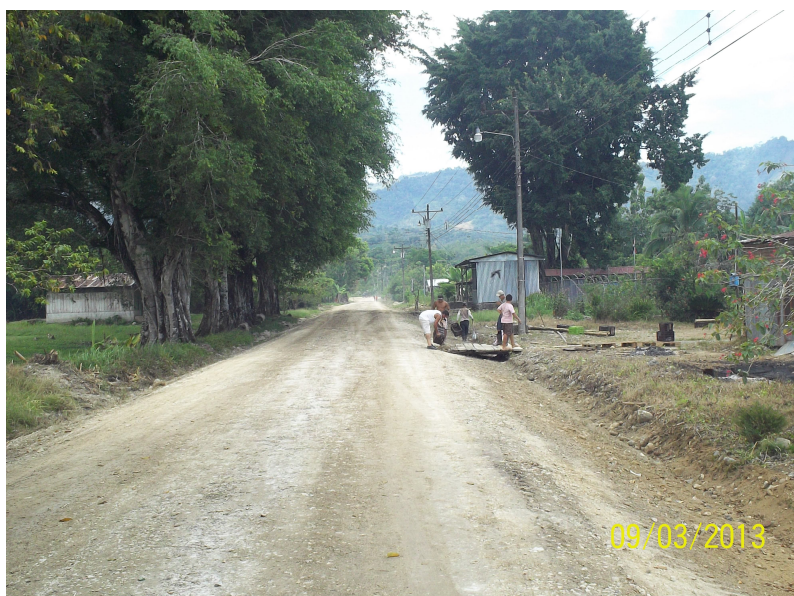
Intervención del camino 6-05-160 (Entr.N.2) Venecia a (entr.C.161) Fca Puntarenas, Empacadora.