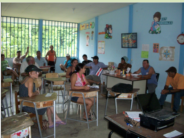
Comunidad, Asociación de Desarrollo y Comité de Caminos de Tres Ríos coordinando con la UTGVM intervención a camino.