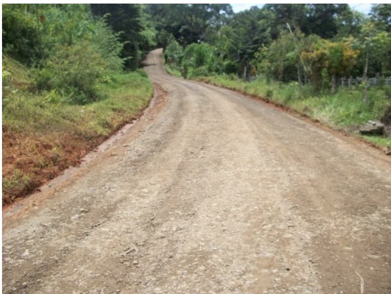
Intervención del camino 6-05-006 (Entr.N.34) Coronado a (Entr.C.87) Tres Ríos