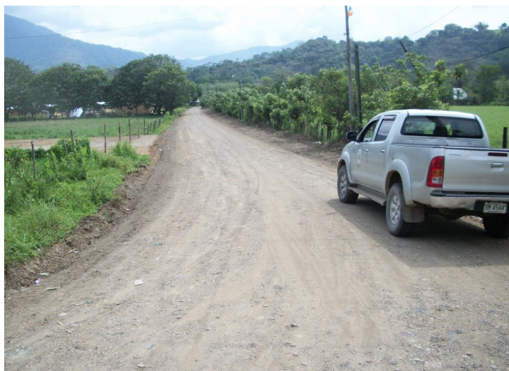
Intervención del camino 6-05-193 Calles Urbanas Cuadrantes Urbanización El Tecal.