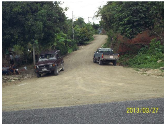
Camino 6-05-015 (Entr.N.2) Las Huacas a Sinaí, Iglesia Católica.