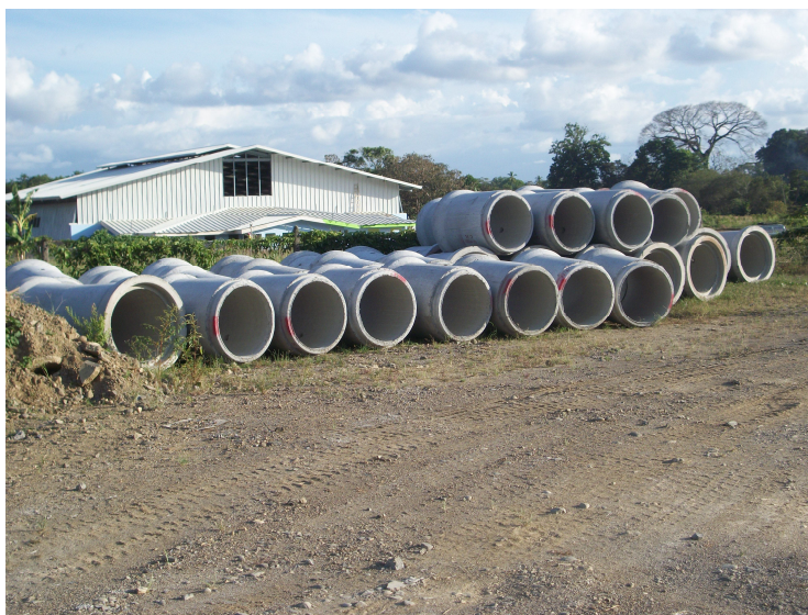
50 unidades de alcantarillas C-76 Clase III 1.25m x 0.80 m