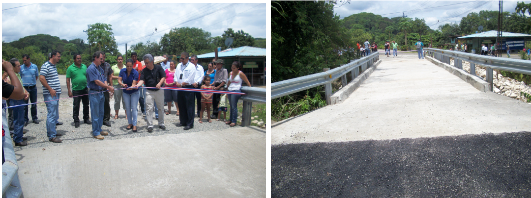
Vecinos de la comunidad de La Guaría de Piedras Blancas inauguran con autoridades locales puente realizado en convenio entre la Municipalidad, MOPT, Asociación, Comité de Caminos y el aporte comunal.

2.7.3 Inclusión del modelo de conservación vial participativa: Consiste en la integración de recursos económicos y humano entre al Gobierno Central, la Municipalidad, las organizaciones y la sociedad civil para planificar, ejecutar controlar y evaluar las diversas obras.