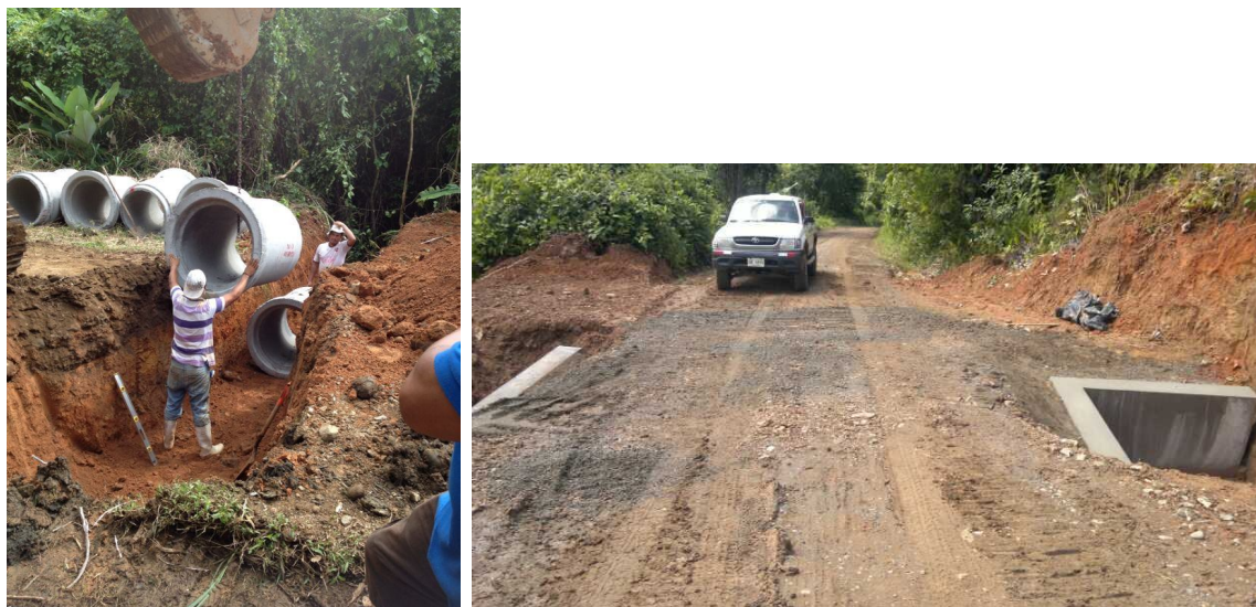
Alcantarillas y cabezales Camino 6-05-067 (Entr.N.34) Uvita a Fca Ballena –La Unión–