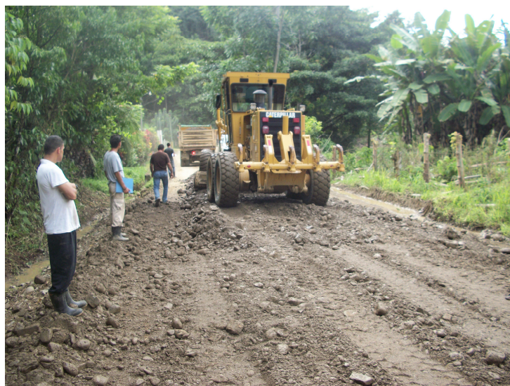
Representante del Comité de Caminos de Tres Ríos, colaborando con la fiscalización y coordinación de trabajos en el camino.

Municipal y las comunidades. Las comunidades colaboran en los procesos de Fiscalización de obras incentivando de esta manera la transparencia, el control Social y el efectivo uso de los recursos asignados a sus comunidades en atención a los caminos vecinales.