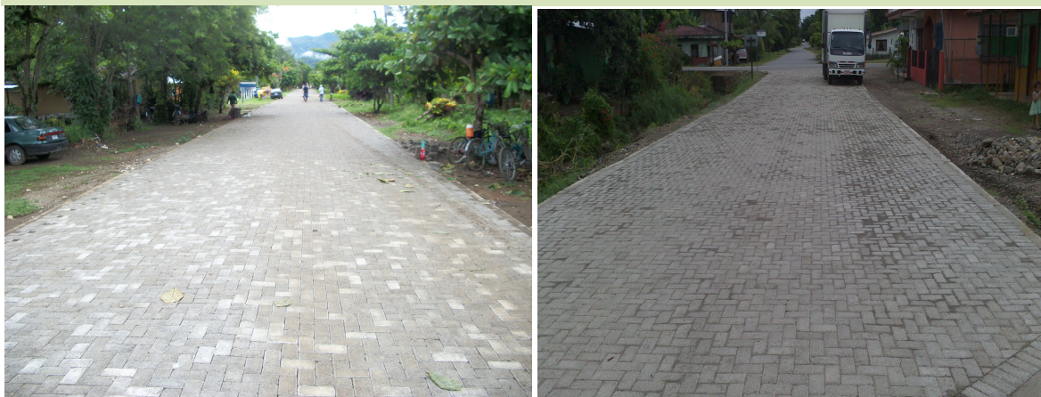
Conclusión de proyecto de adoquines en Barrio Los Almendros en Ciudad

Proyecto Fábrica y colocación de adoquines en Cuadrantes Urbanos de Palmar Norte, sector Iglesia Católica, camino 6-05-020.