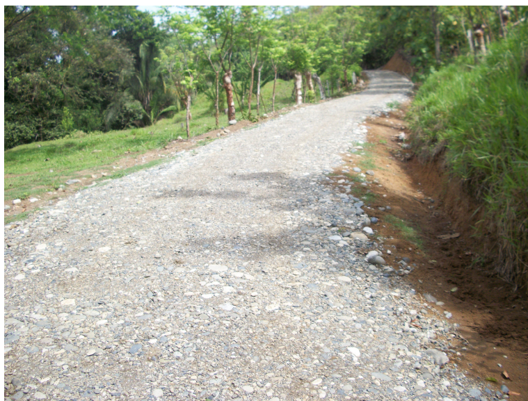
Intervención a camino 6-05-188 (Entr.C.11)Olla Cero, Plaza a Finca Jesús Monge.