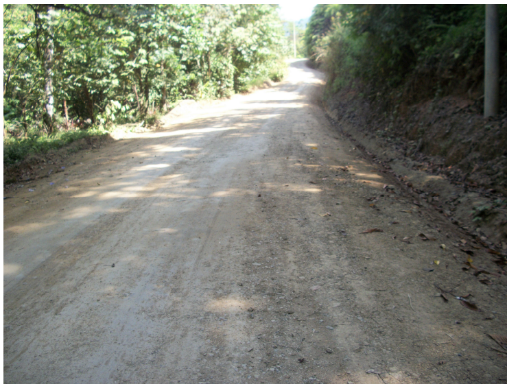
Intervención del camino 6-05-007 (Entr. N.34) Punta Mala a Vergel, Río P. Mala