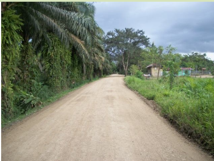
Intervención del camino 6-05-170 (Entr.N.2) Puerta del Sol a (Entr.C.169) Fca Jalaca, Fca Guanacaste.