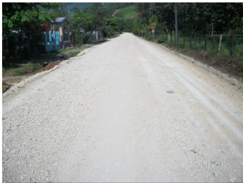
Intervención del camino 6-05-085 (Entr.N.34) Coronado a Coronado, Escuela