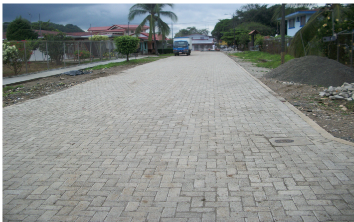
Proyecto de adoquines en Palmar Norte, sector Iglesia Católica.