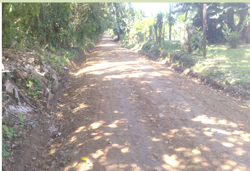
Intervención del camino 6-05-072 (Entr.N.34) Ballena a Playa Ballena, Parque Nacional Marino