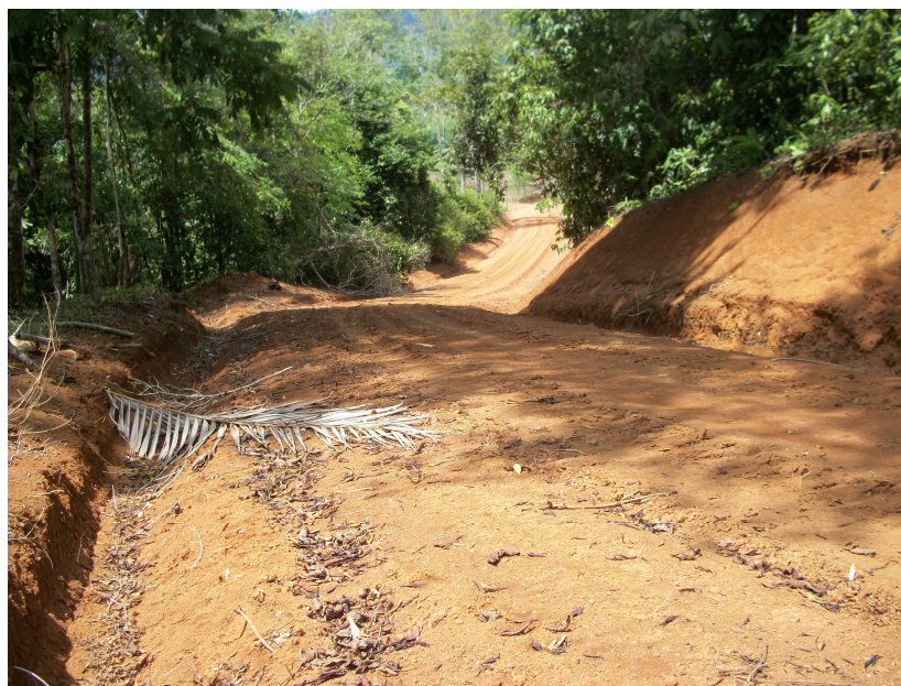
Sector Los Ángeles parte trocha.