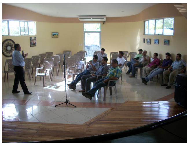
Capacitación sobre tema Ley General de Caminos Públicos y Normativa Conexa impartida por DGM MOP.