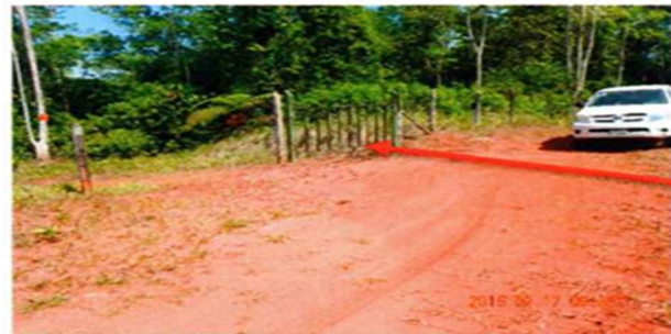
Portón ubicado en el camino, obstruye el libre paso