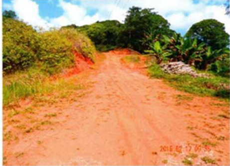
Inicio del camino desde la RN 245, Mogos.