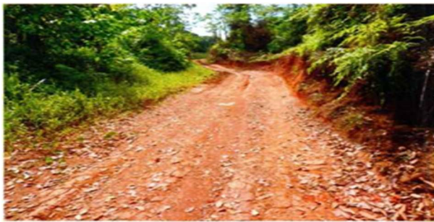
Parte intermedia del camino de PORVENIR