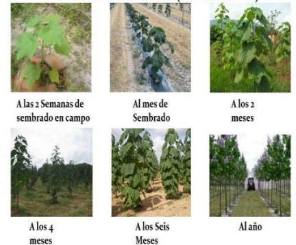
A las 2 Semanas de sembrado en campo