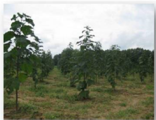
20 Week Old Mass Planting